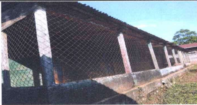
Foto 1: Reparación y sustitución de las paredes por ser antiguos de construcción.